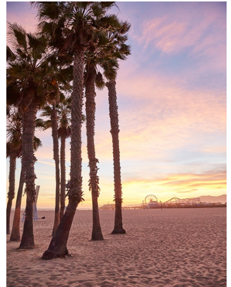
Santa Monica, Californie